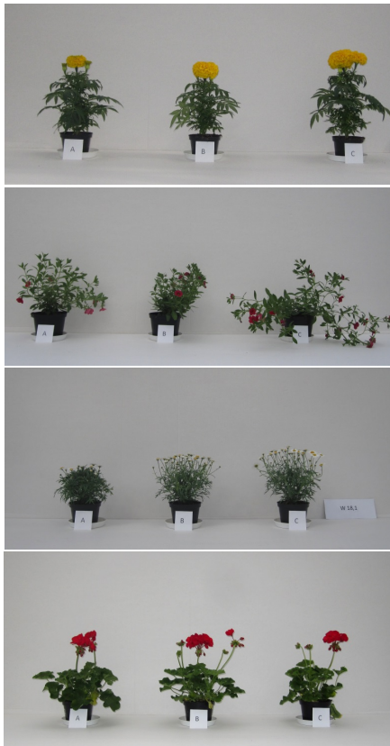
Bild 2-5: Utplanteringsväxter (från ovan: Tagetes, Calibrachoa, Margerit och Pelargon) som fått olika typer av tillväxtreglering; A: Smalspektrumljus+kort fotoperiod, B: Kemisk retardering, C: Ingen retardering.

behandling som fått "ljusretardering". Troligtvis skulle detta problem kunnat elimineras genom att öka dagslängden de sista två veckorna av kulturtiden. Det mesta av reduktionen i sträckning har då redan inträffat.