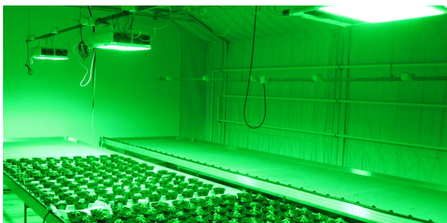
Bild 1: Försöksuppställning med styrbara LED-armaturer och mörklägningsväv.

I ett försök med olika utplanteringsväxter kombinerades erfarenheter från en lång serie försök med korta fotoperioder och smalspektrumljus. Växterna som användes var Calibrachoa 'Callie Bright Red', Tagetes 'Gold lady', Pelargon 'Americana Deep Red' och Margerit 'Molimba White'. Som grund fick växterna 8 timmars fotoperiod (08:00-16:00), reglerat med kortdagsväv (ILS Hortiroll, XLS Obscura, Ludvig Svensson). Utöver detta gavs två timmar med orange-rött ljus (620 nm) klockan 06:00-8:00, två timmar grönt ljus (525 nm) kl. 16:00-18:00, samt rött ljus (660 nm) tillsammans med det naturliga ljuset kl. 8:00-16:00 (figur 1). Smalspektrumljuset gavs med låg intensitet, det gröna och orangeröda ljuset i slutet resp. början av dagen med c:a 20 \mu\text{mol}/\text{m}^2/\text{s} och det röda 660 nm ljuset under dagen innebar ett tillskott på c:a 30 \mu\text{mol}/\text{m}^2/\text{s} . Styrbara LED-armaturer (Helio-