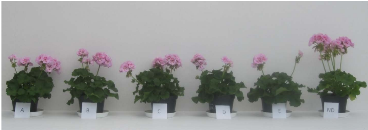
Bild 1: Pelargon i de fem behandlingarna A-E enligt figur 1 + "ND", som har vuxit i naturligt ljus vid naturliga dagslängdsförhållanden.

För pelargon gav alternativ D den kortaste internodielängden, medan övriga plantparametrar var opåverkade av de olika behandlingarna (bild 1).