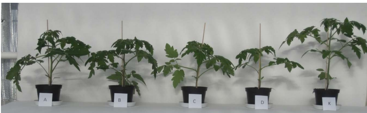
Bild 3: Tomatplantor som belysts med olika ljuskällor: A: lysrör, B: LED vit+röd (620), C: LED vit+röd (660), D: LED vit+blå (460 nm), K: HPS.