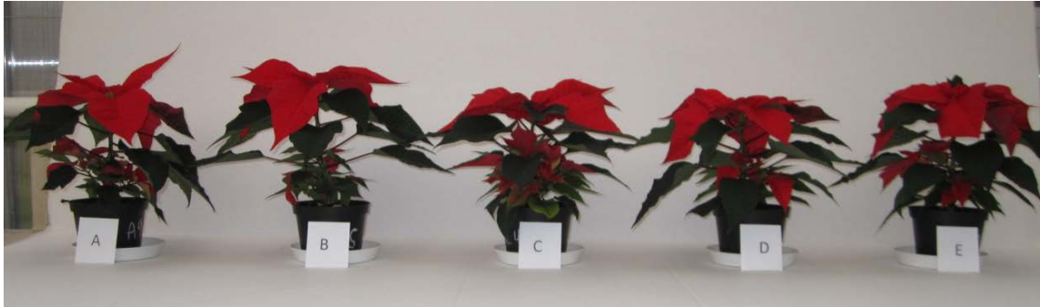
Bild 2: Julstjärna som fått 8 h fotoperiod med följande tillskott ( 20 \mu\text{mol m}^{-2} \text{s}^{-1} ): A: Inget tillskott, B: vitt ljus, C: Rött 660 nm, D: Rött 620 nm, E: Blått 460 nm.

Tomaterna fick en avsevärt större sträckningstillväxt i HPS-ljus, jämfört med övriga ljuskällor, med en signifikant större internodiellängd. Friskvikten var signifikant lägre i behandlingarna vitt+620 och vitt+460, jämfört med övriga behandlingar, liknande trend gällde för torrvikten. Däremot var sidoskotts-utvecklingen kraftigare i de plantor som belysts med LED-belysning. Även för måttet friskvikt/mm skottlängd fanns skillnader, med lägst värde för HPS-belysta plantor. Lufttemperatur och luftfuktighet i plantskiktet framgår av tabell 1.